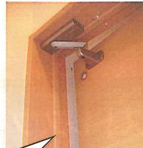
①ゆっくり閉まる 室内ドア