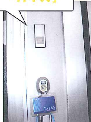
⑤玄関ドア カードキー 「カザス」