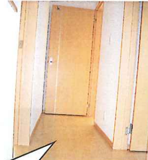
③段差をなくして つまづき予防