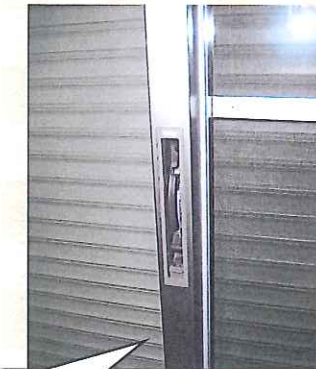
⑥外からカギ位置が 見えない「カクス」